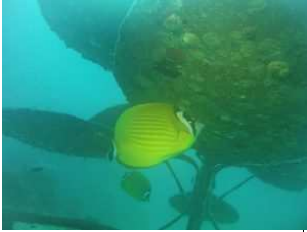
Nog Een butterfly fish die onder de bloem leeft.