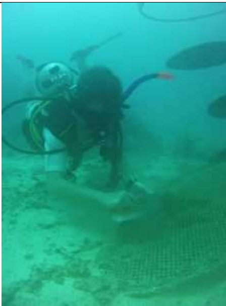
Het alg vrij maken van de bloem