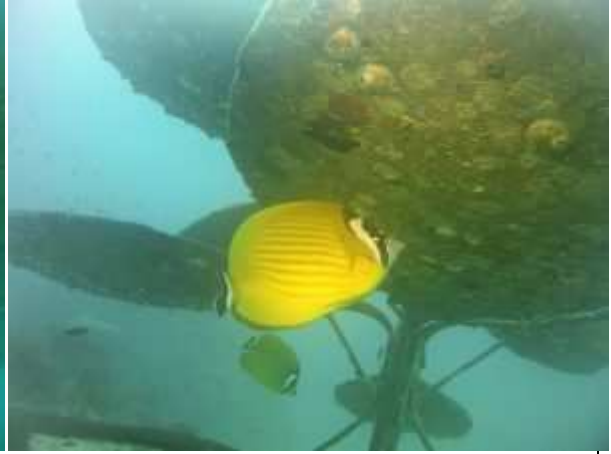
Nog Een butterfly fish die onder de bloem leeft, en nu weer gecorrigeerd.