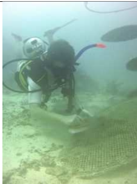
Het alg vrij maken van de bloem, nu met mooie kleuren.